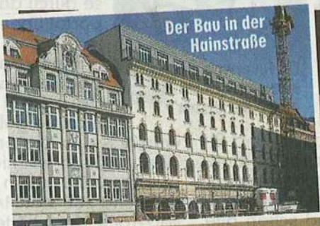
Der Bau in der Hainstraße